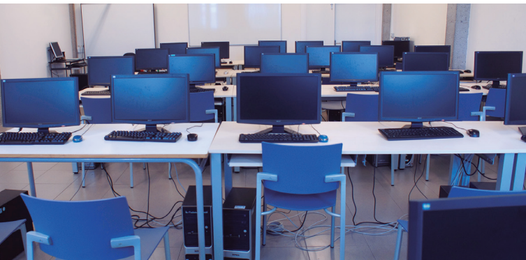
INFORMATIKA GELA / AULA DE INFORMÁTICA